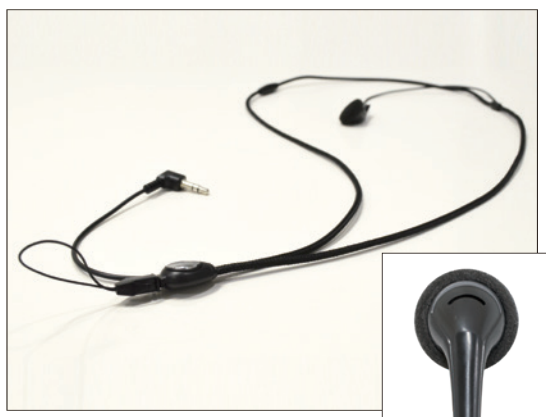
ストラップ一体型イヤホン (標準)