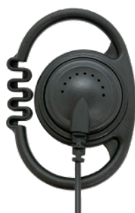
O型耳かけイヤホン

耳に掛ける形状です。 耳掛け部が自由に動きます。 耳の大きさに関係なく、フィットします。