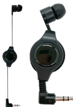
コードリール型イヤホン