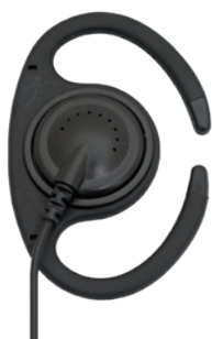
C型耳かけイヤホン

耳栓のようなイヤピースを、耳穴に押し込むイヤホンです。 高遮音性で音漏れも少ないのが特徴。 屋外など騒音の中でも聞き取りやすいタイプです。