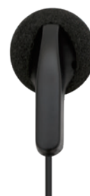
耳差し型イヤホン