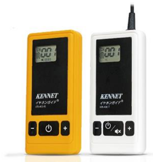
▲イヤホンガイド KR-400 (左) 受信機 (右) 送信機