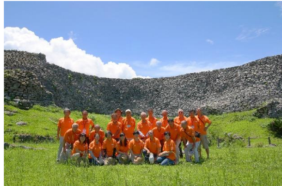
今帰仁グスクを学ぶ会 ガイドの皆様 (右)

「今帰仁城跡」は、首里城跡などとともに、2000年に琉球王国のグスク及び関連遺産群としてユネスコの世界遺産に登録された沖縄県の人気観光スポットです。