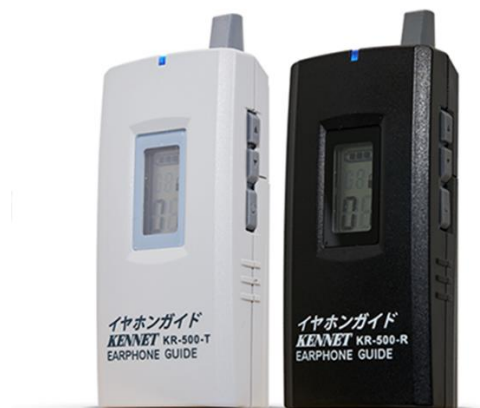
▲イヤホンガイド KR-500 (左) 送信機 (右) 受信機