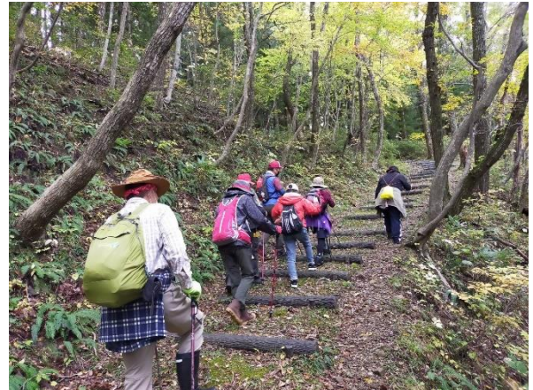
▲奥の細道ウォーキングツアー

宮城県北西部に位置する大崎市は、世界農業遺産にも認定された伝統文化が色濃く残る田園都市です。5つの温泉地で構成される鳴子温泉郷や、県を代表する紅葉の名所「鳴子峡」があることで知られています。豊かな自然から生まれる豊富な食と温泉、暮らしを通して育まれた風土が魅力の人気観光地として注目を集めています。