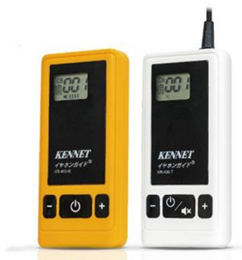
▲イヤホンガイド KR-400 (左) 受信機 (右) 送信機