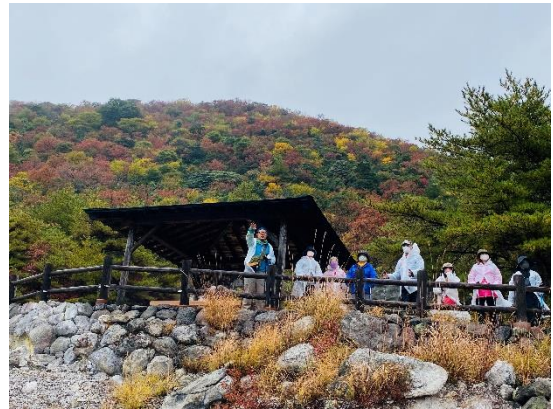
▲ポールウォーキングの様子

「島原半島」は、長崎県南部に位置し、泉質の異なる3つの大きな温泉があることや、半島南北にも温泉が湧くことから「雲仙温泉郷（うんぜんおんせんきょう）」と古くから呼ばれ、親しまれています。他にも、世界文化遺産の「長崎と天草地方の潜伏キリシタン関連遺産・原城跡」や「島原半島ユネスコ世界ジオパーク」などがあり、長崎県を代表する人気観光地となっています。