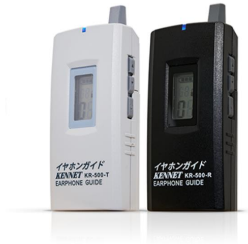
イヤホンガイド KR-500 送信機 (左) 受信機 (右)