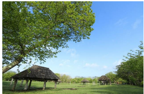
▲御所野遺跡 中央ムラ

御所野遺跡は、今から約5,000～4,200年前の縄文時代中期後半の遺跡で、国の特別史跡として通年公開されている岩手県を代表する人気観光スポットです。本年7月27日に、御所野遺跡を含む「北海道・北東北の縄文遺跡群」について、国連教育科学文化機関（ユネスコ）により世界遺産への登録が正式に決定いたしました。