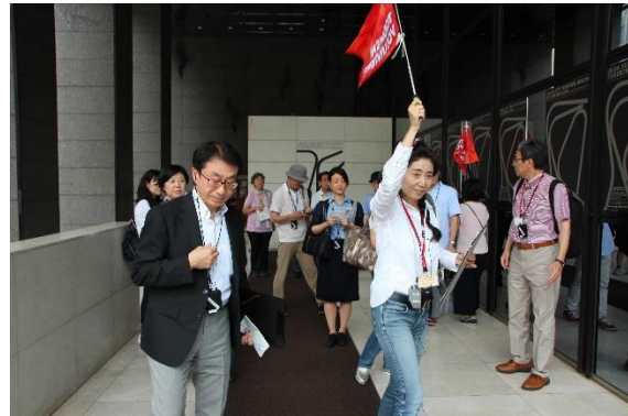
まち歩き産業コース（イヤホンガイド使用中）の様子

中央区観光協会は、中央区内に豊富にある観光資源を活かし、地域の活性化と街づくりに寄与することを目的とし、区内の観光を盛り上げる各種事業を展開しております。