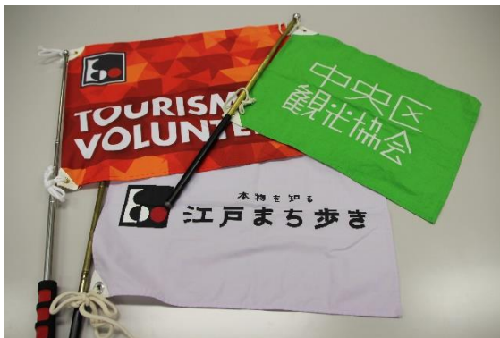
中央区観光協会のツアーガイド用フラッグ

本製品は、送信機と受信機からなる小型無線機で、通常では案内が難しい環境でも快適に内容を伝え聞くことが出来る、国内外で実績のあるロングセラー製品で、旅行関連市場では90%以上の国内シェアを有しております。また、利用された方々からの反響を契機とした企業からのお問い合わせ・採用も増加しております。