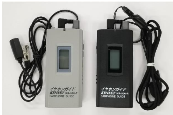
イヤホンガイド KR-500 (左)送信機 (右)受信機