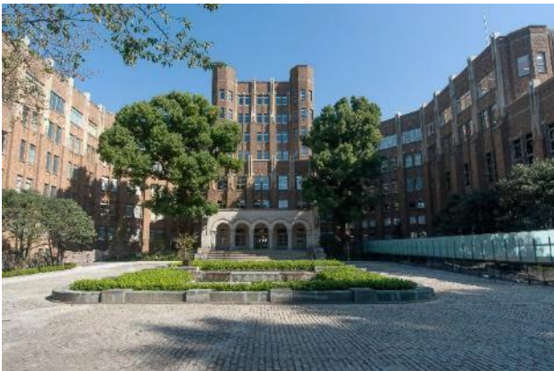
港区立郷土歴史館・外観

当社では、ますます増える観光需要に対応し、今後も多くの企業様を通じて本製品の提供を拡大してまいります。