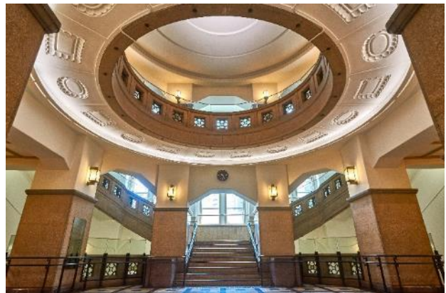
港区立郷土歴史館・内観